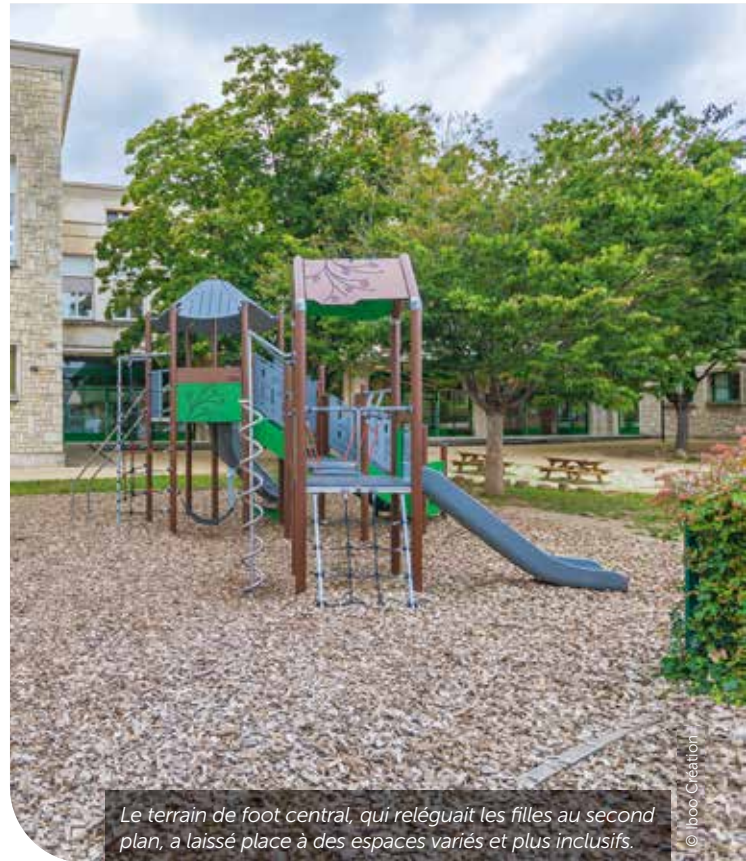
Le terrain de foot central, qui reléguait les filles au second plan, a laissé place à des espaces variés et plus inclusifs.

« La cour est maintenant beaucoup mieux partagée », confirme Séverine Herpe, directrice du groupe scolaire Paul-Blet. Avant, le centre de la cour était occupé par un vaste terrain de foot et les espaces périphériques étaient peu propices à d'autres activités. Le nouvel aménagement apporte de la diversité : un terrain de foot excentré et redimensionné, une structure de jeux, 2 parcours d'équilibre en bois. Le panier de basket a été conservé mais positionné plus bas pour être accessible à tous les enfants. « Maintenant, on joue en groupe à pierre, feuille, ciseaux sur les rondins, et aussi, on fait des bras de fer sur les tables, ou alors on discute », racontent Aya et Kaly, scolarisées à Paul-Blet. ●