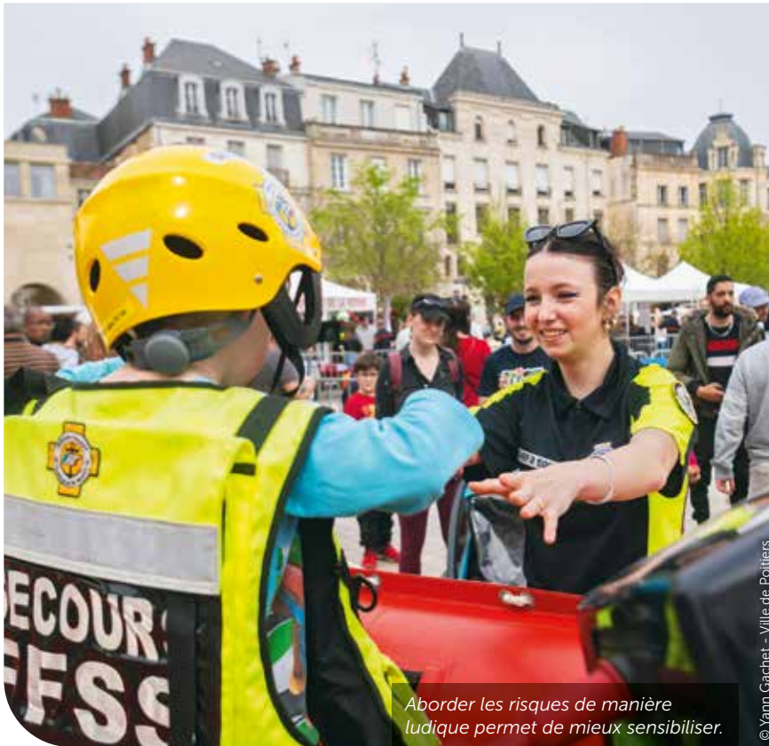
Aborder les risques de manière ludique permet de mieux sensibiliser.