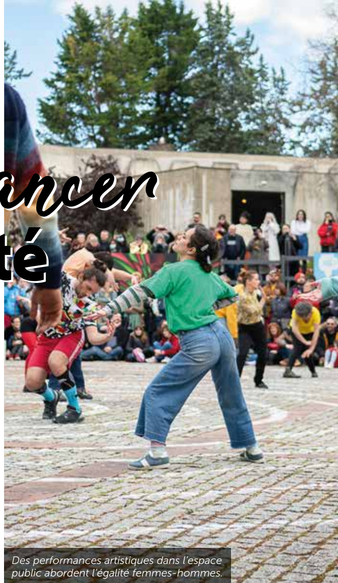
Des performances artistiques dans l'espace public abordent l'égalité femmes-hommes.

acteurs sont engagés dans le réseau Poitiers se mobilise.