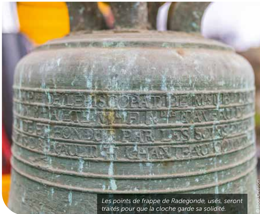
Les points de frappe de Radegonde, usés, seront traités pour que la cloche garde sa solidité.