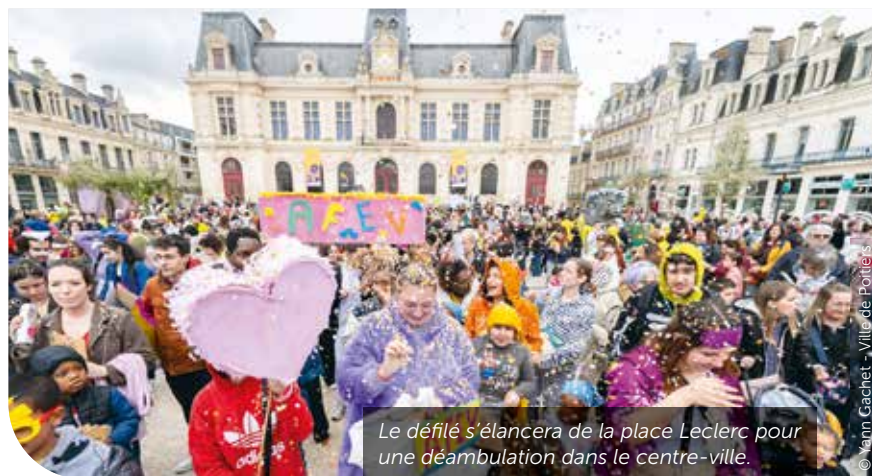
Le défilé s'élancera de la place Leclerc pour une déambulation dans le centre-ville.