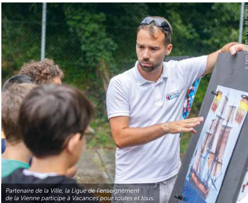
Partenaire de la Ville, la Ligue de l'enseignement de la Vienne participe à Vacances pour toutes et tous.