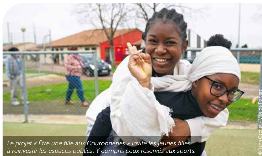
Le projet « Être une fille aux Couronneries » invite les jeunes filles à réinvestir les espaces publics. Y compris ceux réservés aux sports.

Pour la Ville, la représentativité des associations sportives, c'est-à-dire la diversité et l'équilibre entre les différents publics qu'elles accueillent, constitue désormais un critère clé dans l'attribution des subventions. Cette décision fait suite à une concertation menée avec le mouvement sportif.