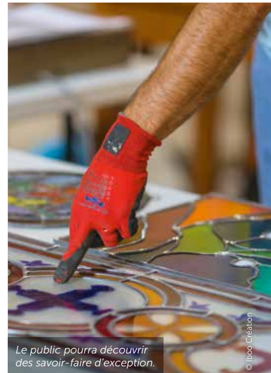
Le public pourra découvrir des savoir-faire d'exception.

L'expérience ne s'arrête pas là : la Maison du chantier invite à d'autres découvertes et à un programme d'animations. Une maquette tactile permet d'appréhender du bout des doigts les détails de l'église, tandis qu'un espace est destiné aux enfants. Un film projeté sur grand écran permet de pénétrer à l'intérieur de l'église. Au menu des animations, il y aura des rencontres mensuelles avec des artisans. Ils partageront leur savoir-faire durant des conférences et des ateliers. Des rendez-vous de 30 minutes seront également organisés lors de pauses méridiennes, pour suivre l'avancement des travaux en temps réel. La Maison du chantier, en accès libre, s'annonce donc comme un lieu incontournable pour découvrir, comprendre et apprécier la richesse de ce chantier de restauration hors du commun. ●