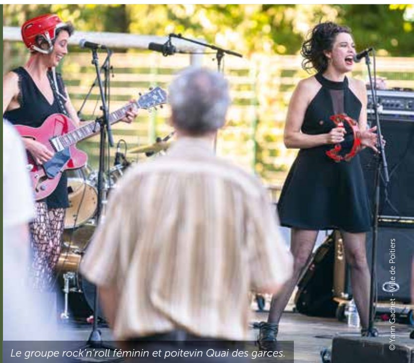
Le groupe rock'n'roll féminin et poitevin Quai des garces.