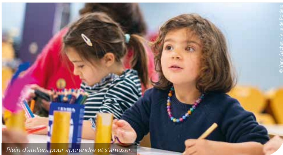
Plein d'ateliers pour apprendre et s'amuser.