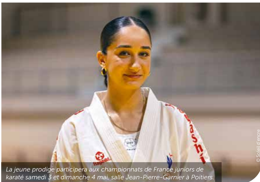
La jeune prodige participera aux championnats de France juniors de karaté samedi 3 et dimanche 4 mai, salle Jean-Pierre-Garnier à Poitiers.