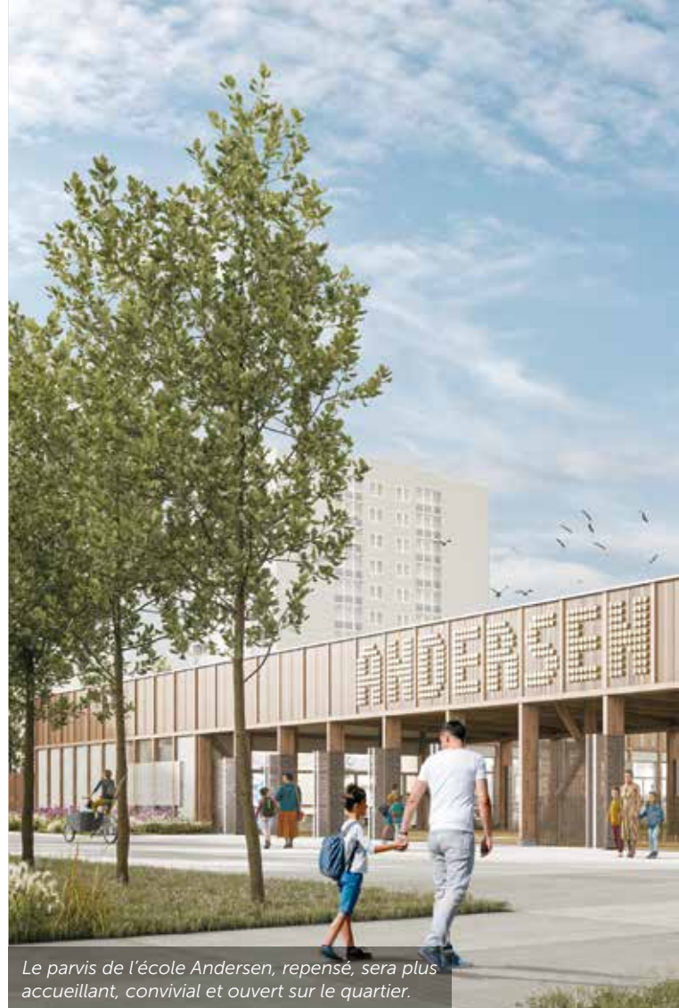
Le parvis de l'école Andersen, repensé, sera plus accueillant, convivial et ouvert sur le quartier.