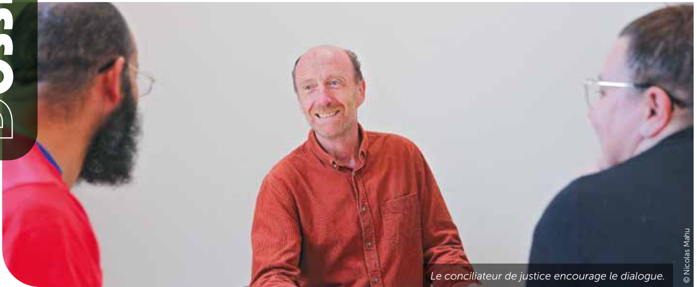
Le conciliateur de justice encourage le dialogue.