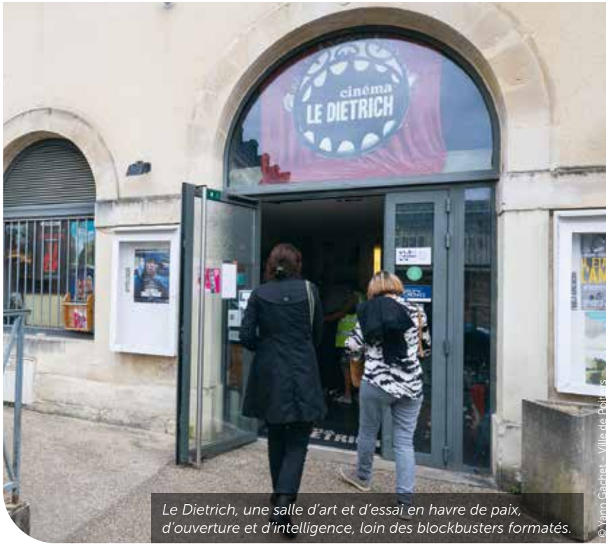
Le Dietrich, une salle d'art et d'essai en havre de paix, d'ouverture et d'intelligence, loin des blockbusters formatés.