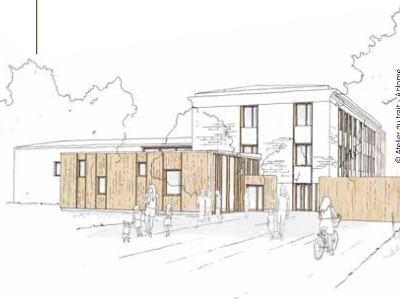
© Atelier du trait - Ablomé

Aux Trois-Cités, la réhabilitation du centre socioculturel (CSC) du Clos-Gaultier est enclenchée jusqu'en 2026. Le point sur l'actualité des travaux.