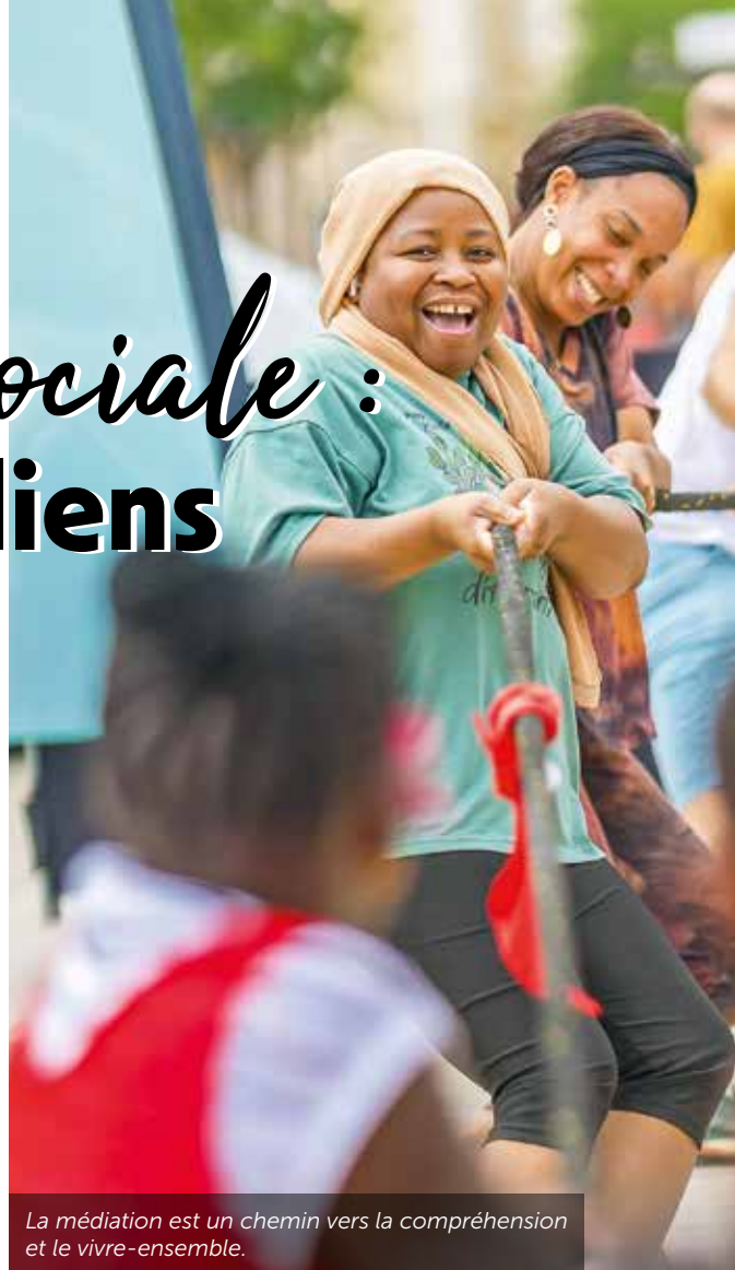
La médiation est un chemin vers la compréhension et le vivre-ensemble.

8 médiateurs sociaux vont contribuer au lien social.