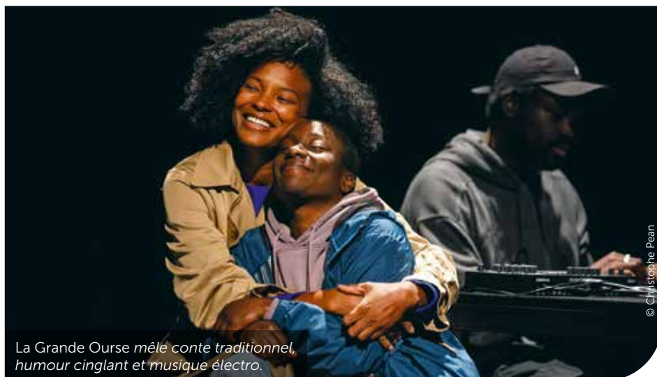
La Grande Ourse mêle conte traditionnel, humour cinglant et musique électro.