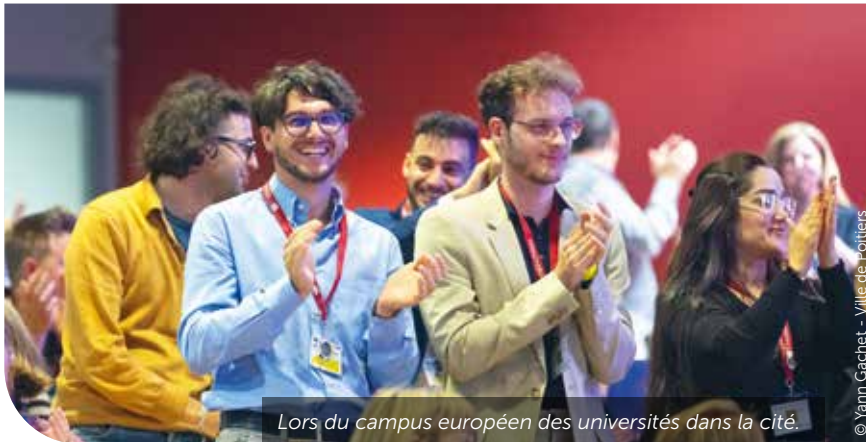
Lors du campus européen des universités dans la cité.