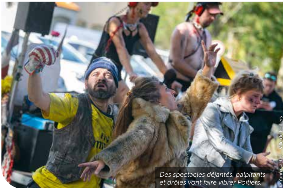
Des spectacles déjantés, palpitants et drôles vont faire vibrer Poitiers.