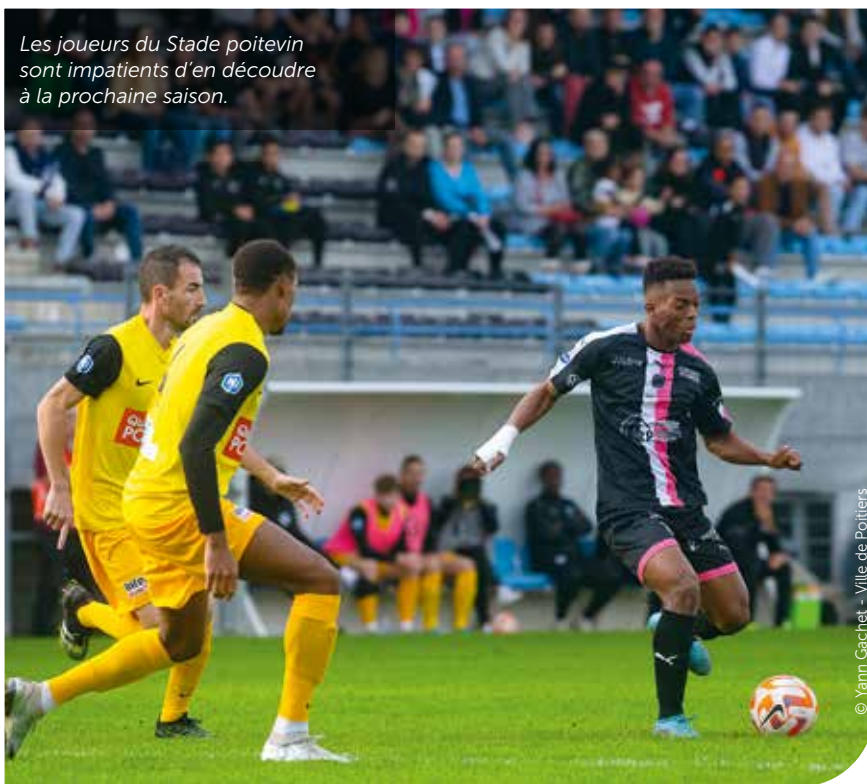
Les joueurs du Stade poitevin sont impatients d'en découdre à la prochaine saison.

Le stade Michel-Amand vient d'être équipé d'un revêtement synthétique avec un remplissage biosourcé en liège. À la clé, moins d'entretien, moins de consommation d'eau, et des activités maintenues malgré les intempéries.