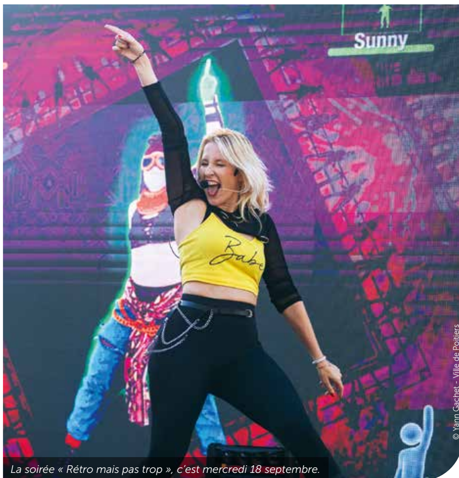
La soirée « Rétro mais pas trop », c'est mercredi 18 septembre.

« Poitiers express », inspiré d'un célèbre jeu télé, propose un itinéraire semé d'épreuves, des défis sportifs comme des énigmes, entre le campus et le centre-ville (10/10). Tison accueille une journée de découverte des territoires d'outre-mer : culture, gastronomie, artisanat (7/09)... Du côté des incontournables, il y a bien sûr la Color campus (12/09), une