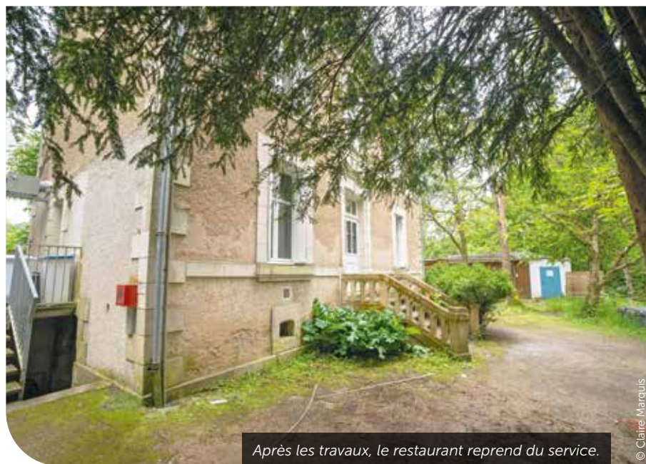
Après les travaux, le restaurant reprend du service.