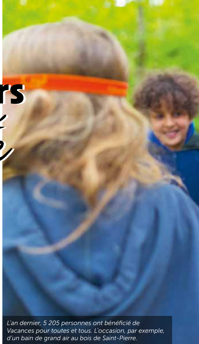
L'an dernier, 5 205 personnes ont bénéficié de Vacances pour toutes et tous. L'occasion, par exemple, d'un bain de grand air au bois de Saint-Pierre.

12 concerts 4 bals 6 spectacles 11 animations