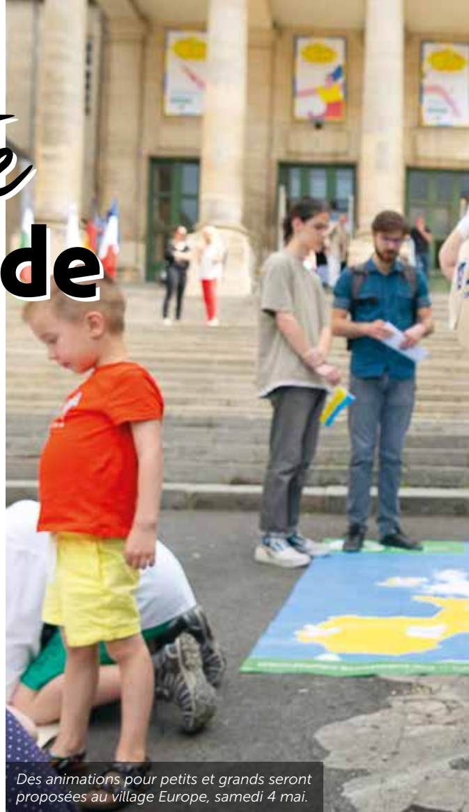
Des animations pour petits et grands seront proposées au village Europe, samedi 4 mai.

Lundi 6 dès 14h et mardi 7 mai de 8h30 à 17h, chacun est invité à participer au Makeathon EC2U « Réinventer l'avenir ! » au QG sport-santé 1 boulevard Lavoisier à Chasseneuil-du-Poitou. Le concept ? Des équipes d'étudiants, de chercheurs, de citoyens développent ensemble des solutions innovantes. L'événement a lieu simultanément à Coimbra, Iasi, Iena, Pavie, Turku, Salamanque et... Poitiers ! Mardi 7 à 20h15 au TAP Castille, projection du film culte L'Auberge espagnole . Mercredi 15 mai de 11h à 13h, Europe Direct invite à un quiz sur les pays de l'UE. Samedi 18 mai à 11h, direction la médiathèque François-Mitterrand pour un concert de l'Europe. Aussi, pour initier les papilles aux mets européens, un tour d'Europe gourmand est prévu dans les restaurants scolaires du 27 au 31 mai. ●