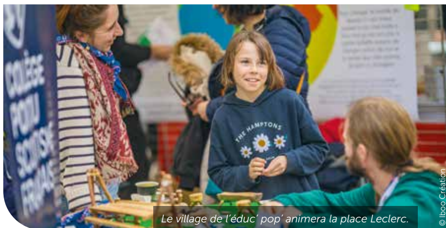
Le village de l'éduc' pop' animera la place Leclerc.