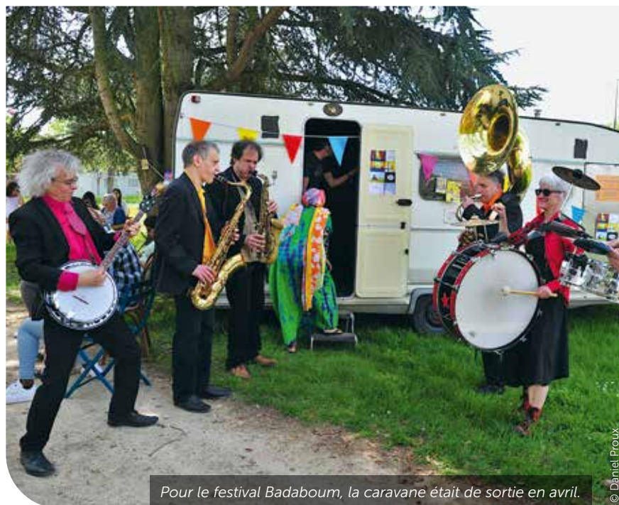
Pour le festival Badaboum, la caravane était de sortie en avril.