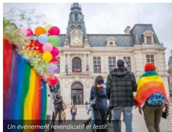
Un événement revendicatif et festif.

Le collectif LGBTQIA+86 organise la marche des fiertés de Poitiers samedi 4 mai. C'est la première fois que ce moment festif et militant, ponctué de manifestations artistiques, est chapeauté par ce collectif qui regroupe de nombreuses associations. Cette journée est l'occasion pour la communauté LGBTQIA+ de se retrouver et d'être visible, mais pas seulement. « C'est tout à la fois une fête, la joie de danser et d'être libre dans son corps, voire une libération quand on se cache le reste de l'année, expliquent des membres du collectif. C'est aussi un moment de commémoration et de revendications où l'on s'oppose à toute régression de nos droits. » Un village des associations sera organisé place Leclerc, avant un départ des chars et du cortège en début d'après-midi vers le Parc de Blossac. ●