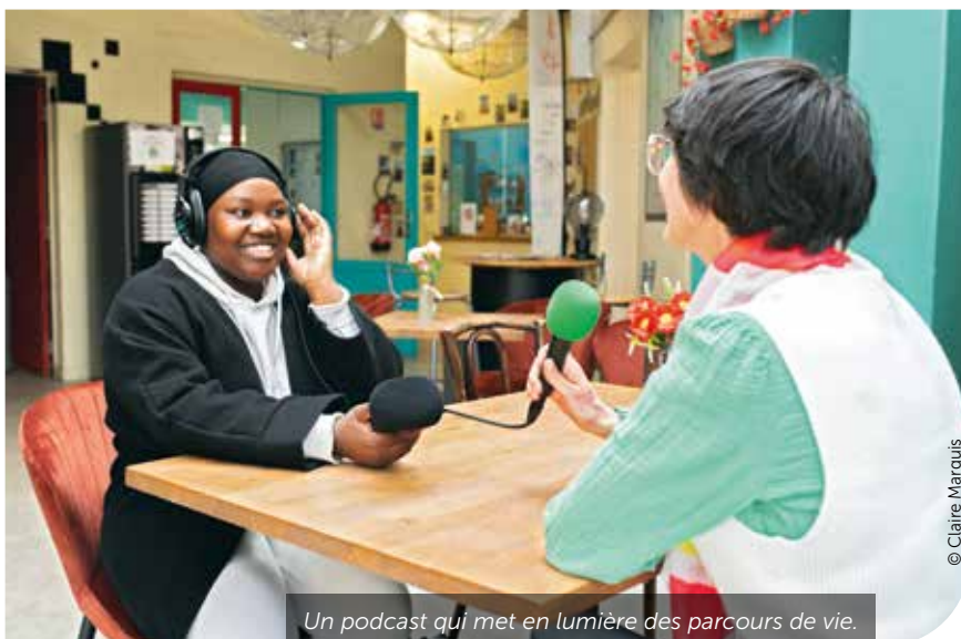
Un podcast qui met en lumière des parcours de vie.